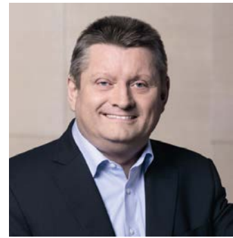
Hermann Gröhe Bundesminister Mitglied des Deutschen Bundestages